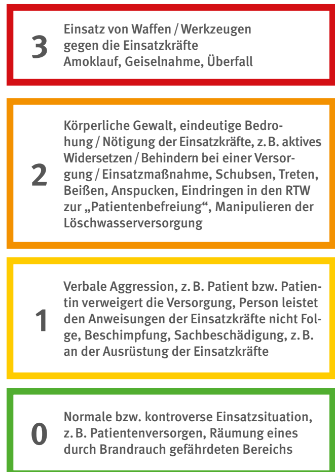
Abb 3 Die vier Gefährdungsstufen des Aachener Modells

Gemäß dem Aachener Modell lassen sich grundsätzlich vier Gefährdungsstufen unterscheiden: